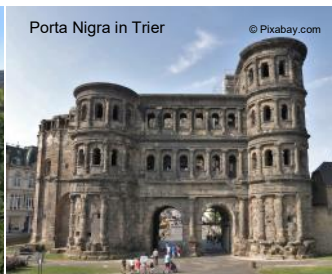
Porta Nigra in Trier